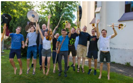
Viel Freude haben die Musiker, die Lobpreis, Gottesdienste und Anbetungszeiten gestalten.