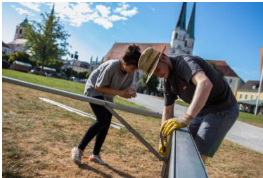
Die Volontäre helfen im Hintergrund und erleben eine tolle gemeinschaftliche Zeit.