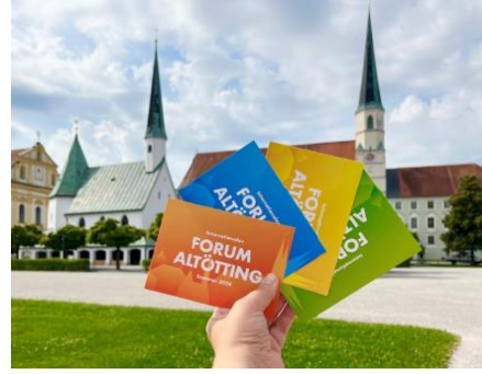
Postkarten in den Forums-Farben