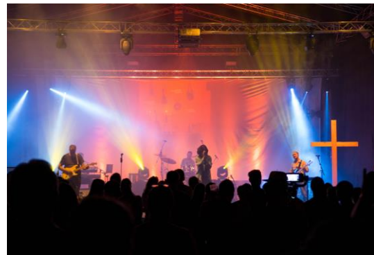
Das Emmanuel Youth Forum bietet für 18- bis 30-Jährige ein eigenes Programm.