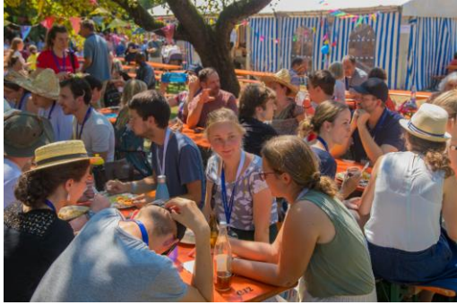
Begegnungen bei den Essenszeiten