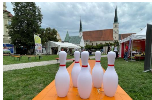
Rund um den Kapellplatz gibt es ein offenes Programm mit Lobpreis, Impulsen, Workshops, Gebetszeiten, aber auch Spiel und Spaß.