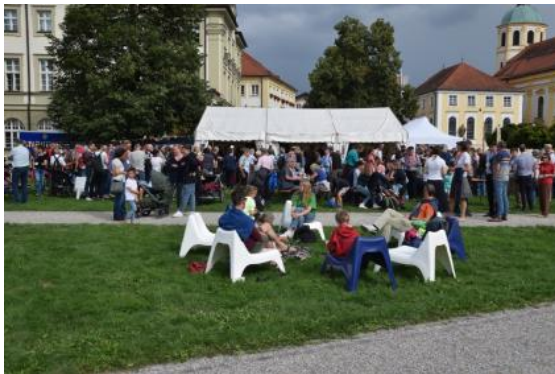
Das Forum Altötting vom 1. bis 4. August 2024 ist ein lebendiges christliches Glaubensfestival für die ganze Familie.

Download: www.emmanuel.de/wp-content/uploads/2024/06/Fotos-2.-Presseinfo_Forum-altoetting.zip