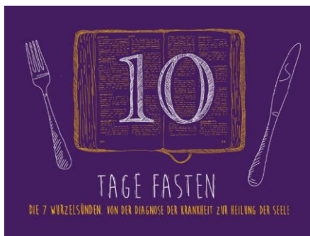
Abb. 1: Keyvisual 10 Tage Fasten